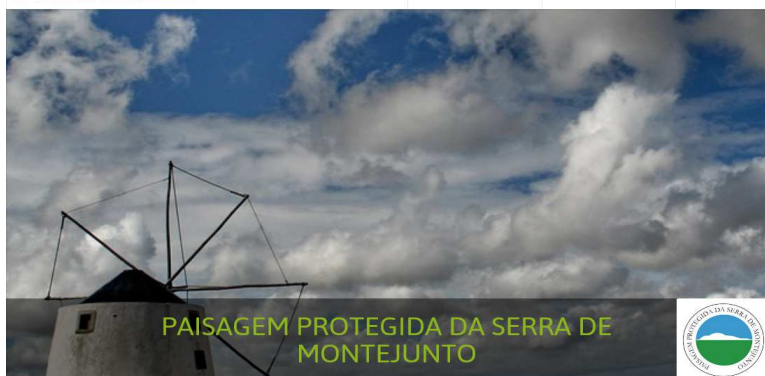
PAISAGEM PROTEGIDA DA SERRA DE MONTEJUNTO