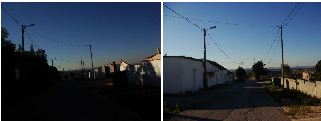
Rua Casal Valverde

Ilustração da Área de Reabilitação Urbana proposta: