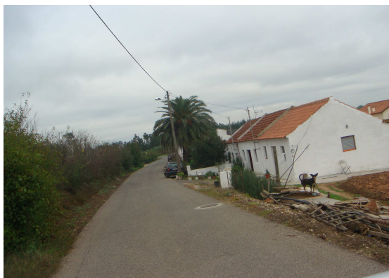
Estrada das Lameiras