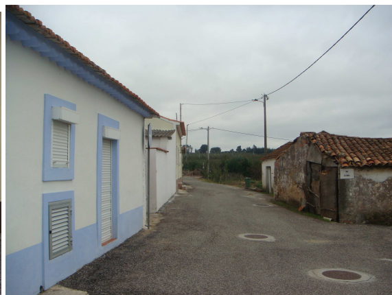
Rua das Lameiras