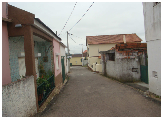
Rua das Lameiras