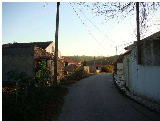
Rua José Coelho