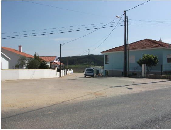
Travessa dos Arneiros