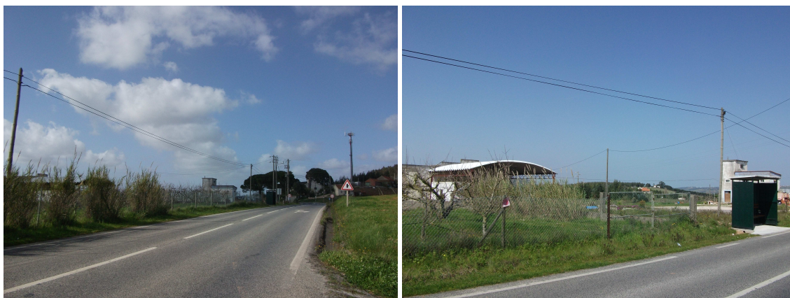
Ilustração da Área de Reabilitação Urbana proposta:

O aglomerado de Alto do Bacalhau situa-se a norte da Vila do Cadaval, o seu acesso é efetuado através da Rua Alto de Bacalhau (E.N 361) e corresponde a um pequeno aglomerado, na sua totalidade em propriedade privada e em mau estado de conservação.